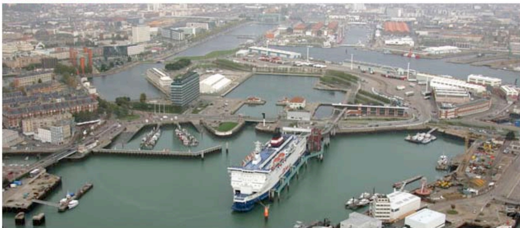
Vue aérienne du port du Havre